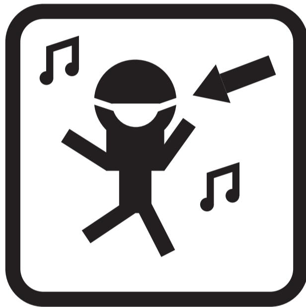
Šokame su kaukėmis