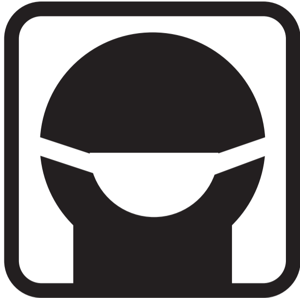
Ateiname su kaukėmis